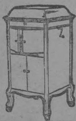
Victor-Victrola XIV $150