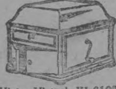
Victor-Victrola XI, $100